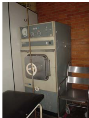
Figura 10 Auto-Clave fora de funcionamento nas dependências internas da UMAMP.