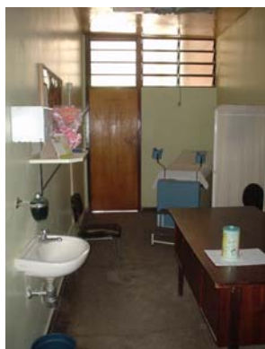
Figura 5 Consultório bem iluminado e arejado.

Não foram detectados nos consultórios problemas comuns a algumas unidades de saúde, como infiltração, rachaduras, goteiras, etc. No entanto, os lavatórios não dispunham de toalha de papel e os reservatórios de lixo não estavam tapados. O estado da rouparia não era o ideal.