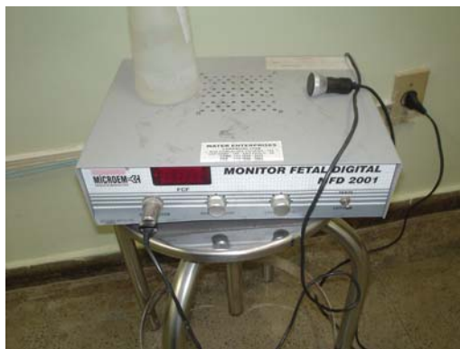
Figura 9 Monitor Fetal.

Obs.: O PSF não utiliza este equipamento