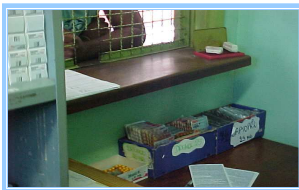
Foto 05 balcão da farmácia